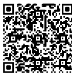
PRAXISBEISPIEL DIGITALE FERTIGUNG